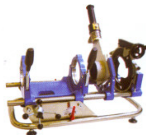
MP 110 UD