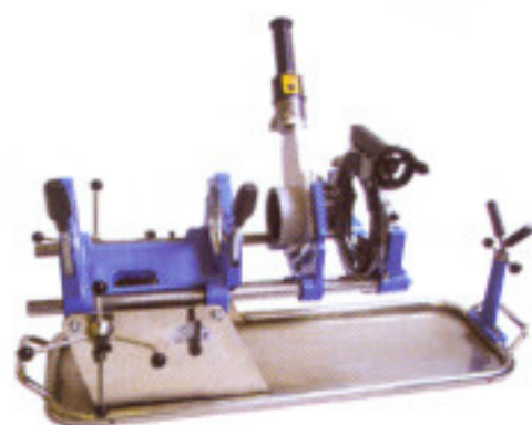
MP 110 UM

Суппорт может быть зафиксирован в любой позиции, и с приспособлением можно легко манипулировать с обеих сторон. Механизм подачи упрощает соблюдение технологических режимов, при которых необходимо нагревать трубу и фасонную часть постепенно. Этот незаменимый помощник поставляется в комплекте со специальным сварочным аппаратом и необходимыми вкладышами.